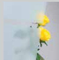
Szkoło ze wzorem